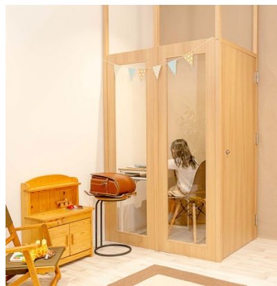
子供の勉強スペースに