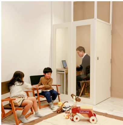
在宅でのワークスペースに