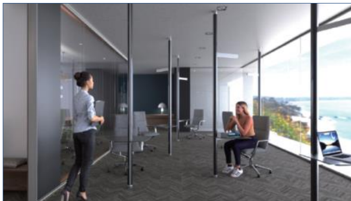
▲利用シーンイメージ

Tomarikiは、床と天井をつなぐポール形状の商品となっており、様々な空間に小スペースで設置することが可能です。デスクや照明、モニターを設置することで、オフィス空間にオープンなワークスペースやミーティングスペースを構築することができます。