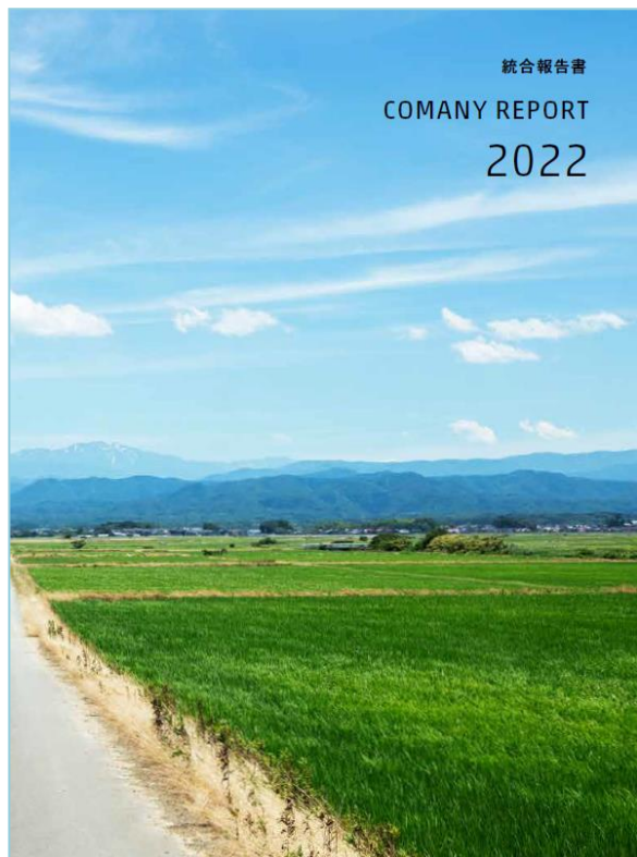
▲コマニーレポート2022表紙

今後も、ステークホルダーの皆さまとのコミュニケーションを大切にしながら、コマニーグループならではの企業価値創造に取り組んでいきます。