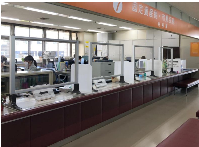
▲ 窓口カウンターに設置した様子

今回発売した『U / P(アップ)』や『HBE』といった商品を通して、当社ではこれまでになかった、目に見えない細菌やウイルスから大切な人を守るといった安心・安全な環境の提供をしております。