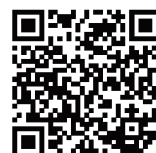
▲統合報告書QRコード

コマニーグループ統合報告書閲覧 URL: https://www.comany.co.jp/sdgs/report/