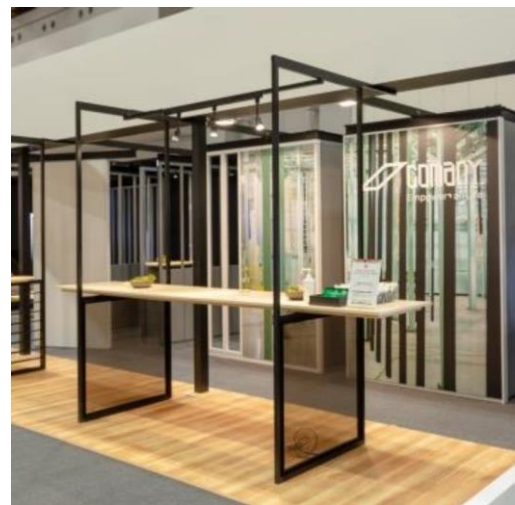
カウンター天板仕様

今回の商品では、これからの「はたらく」間づくりの一つとして、「立ち話」に焦点をあてました。まず、会議の前後にPCを抱えたまま立ち話をする間（ま）では、公式的な場では発散しづらい小さな閃きやモヤモヤを共有したり、会話のきっかけや意見に繋がりをつくるアイスブレイクなど、心理的安全性が高まる間づくりを実現します。また、他部門のワーカーとばったり会って立ち話をする間では、部門連携やイノベーションにつながる可能性のある情報共有を促します。