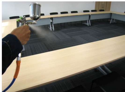
▲Health Bright Evolutionの塗布の様子

施工には噴霧器を使い直接壁や天井に塗布します。無色透明・無臭の液体であるため、施工時の養生は不要です。また、木・スチール・ガラス・レザーなど素材を選ばず施工が可能です。