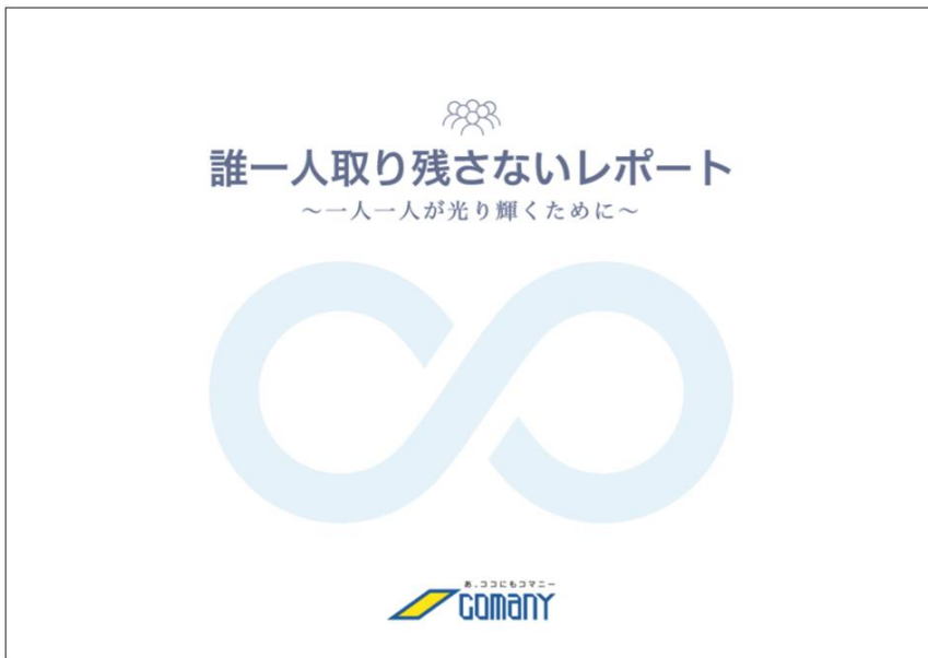
▲誰一人取り残さないレポート表紙

このレポートでは、コマニーの目指す姿や独自性・社会性のある活動と商品を紹介しています。企業経営を行う上で特に幸福にすべき人達や、それらの人達をコマニーの技術で幸福にする取り組み事例、達成に向けた活動を詳細に記しており、ステークホルダーの皆様にご理解していただけるツールになっています。