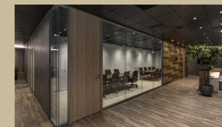
ガラスパーティション BRIDIA (ブリディア)