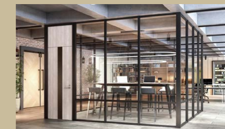
デザインパーティション Xis-tone (エクシス・トーン)